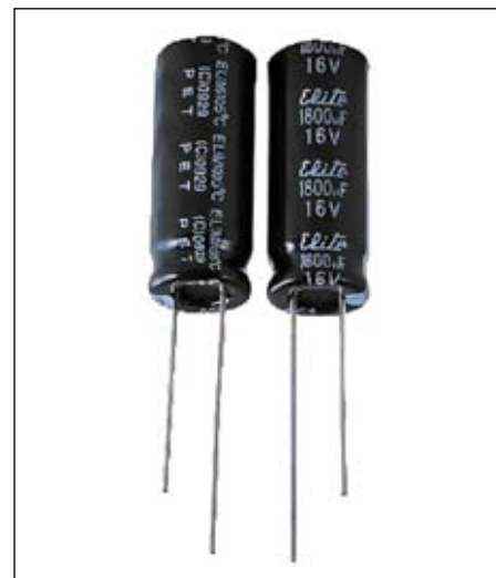
Рис. 3. Внешний вид конденсаторов с проволочными выводами

Внешний вид конденсаторов Elite с проволочными выводами показан на рис. 3.