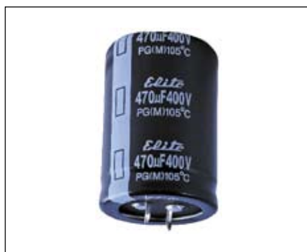
Рис. 1. Внешний вид конденсаторов типа Snap-In