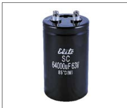
Рис. 2. Внешний вид конденсаторов с терминалами под резьбу

Внешний вид конденсаторов Elite с терминалами под резьбу приведен на рис. 2.