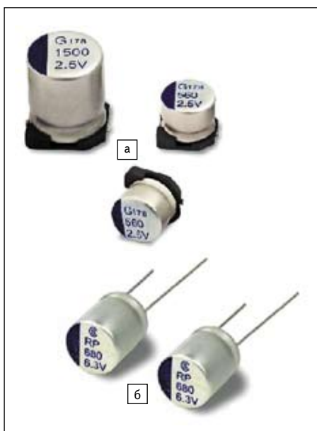
Рис. 5. Внешний вид полимерных конденсаторов: а) для монтажа на поверхность; б) с проволочными выводами

Внешний вид полимерных конденсаторов Elite в корпусах для монтажа на поверхность показан на рис. 5а, а в корпусах с проволочными выводами — на рис. 5б.